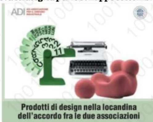
Prodotti di design nella locandina dell'accordo fra le due associazioni

Il design come leva strategica per lo sviluppo sostenibile e l'internazionalizzazione è al centro del protocollo d'intesa firmato ieri a Roma dall'Associazione marchi storici d'Italia e dall'Adi, Associazione per il design industriale. L'accordo, che ha una validità di due anni, vede al primo posto la promozione del valore strategico del design in tutti gli ambiti produttivi, attraverso iniziative che un tavolo congiunto svilupperà in dieci direzioni: design per l'abitare, per la mobilità, per il lavoro, per la persona, food design, dei materiali e dei sistemi tecnologici, dei servizi, per il sociale, ricerca per l'impresa, per la comunicazione. A queste attività si affiancheranno l'internazionalizzazione e l'informazione.